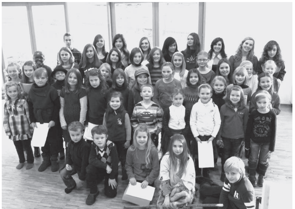
Alle Chöre beim Einsingen für das Krippenspiel 2011

Alle Proben finden im Pfarrheim statt. In den Ferien sind keine Proben.